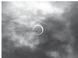
▲2012年5月21日 金環食(編集者)

とっておきの、お気に入りの、写真や絵など投稿しませんか。 友の会事務所にお声がけください。(随時掲載です)